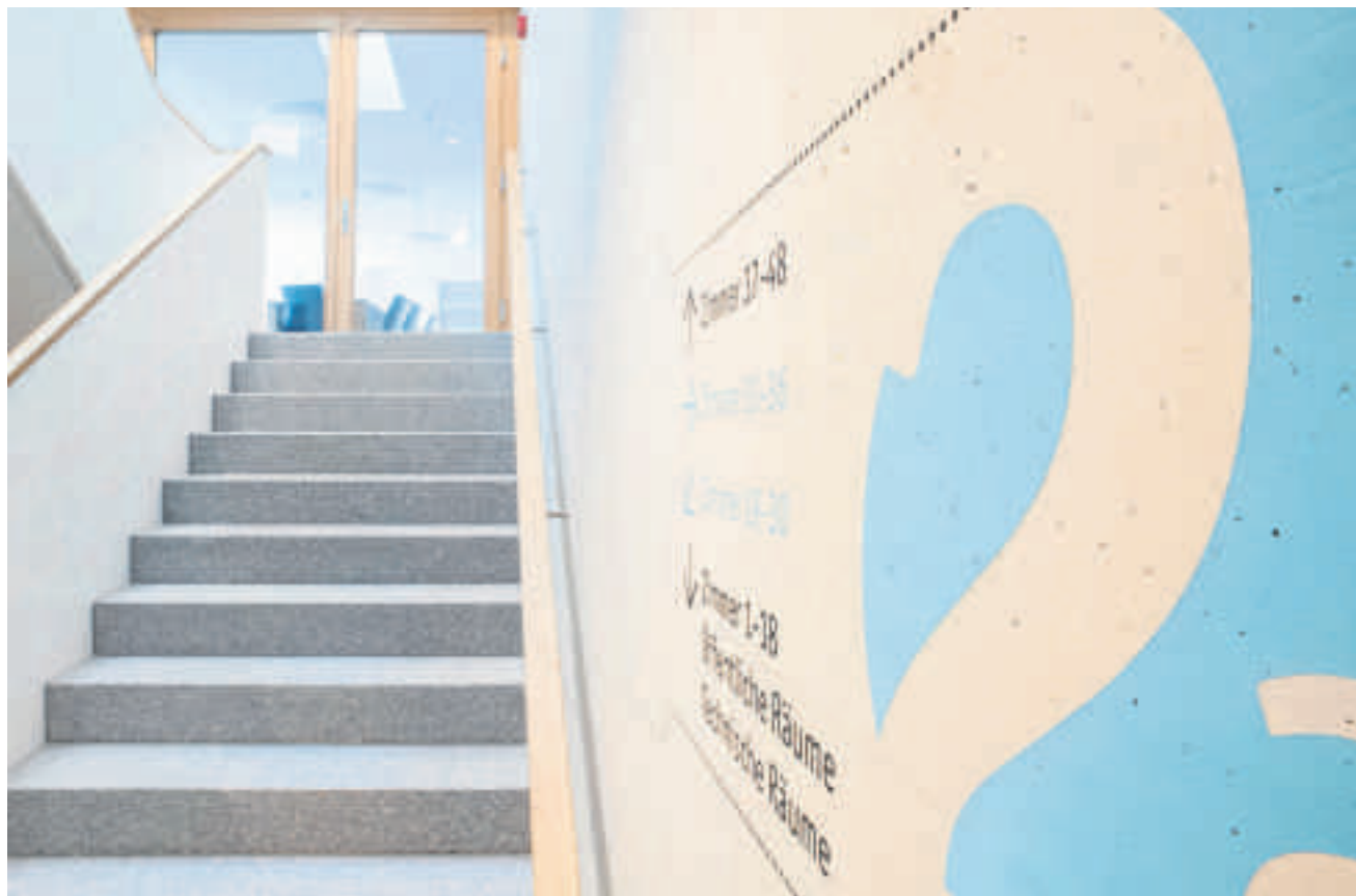
Die räumlich-architektonische Atmosphäre ist ganz auf die Bewohner und die Betreiber des Wohnhauses abgestimmt.

Die Material- und Farbkonzeption basiert auf der Verwendung natürlicher Materialien. Die verschiedenen Gänge wurden mit Kunststein und versetzten runden Leuchten gestaltet, die auch die